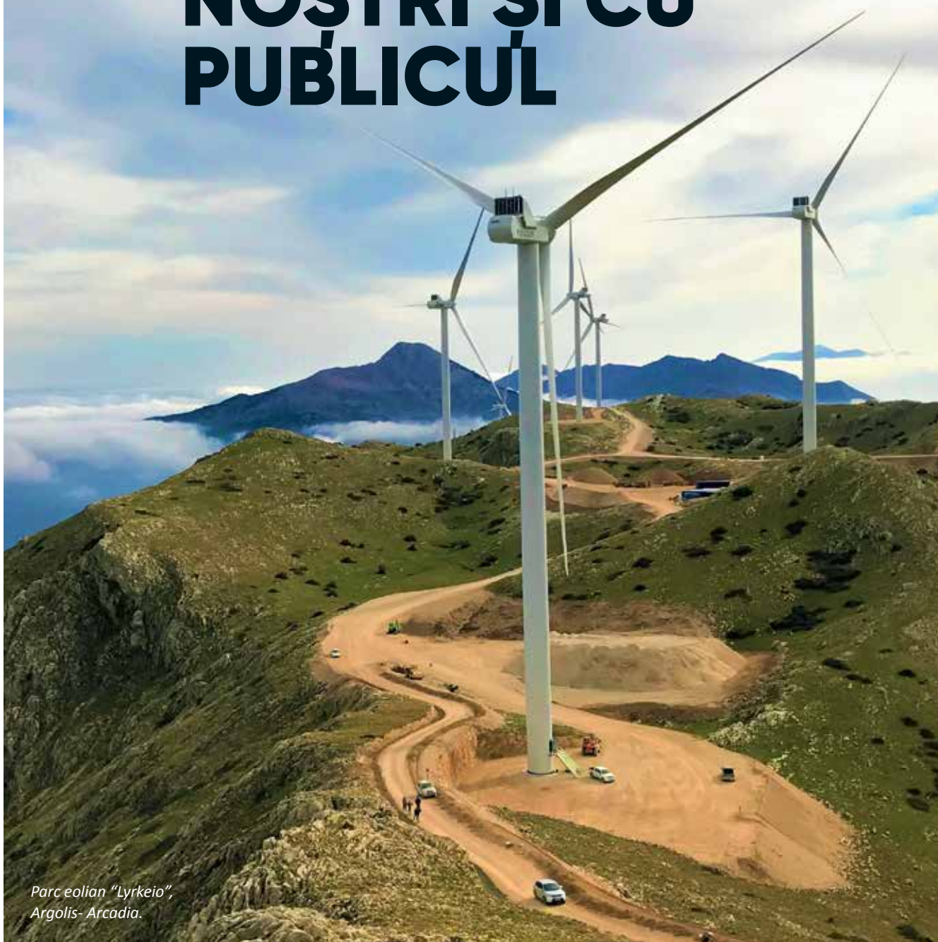
Parc eolian "Lyrkeio", Argolis- Arcadia.