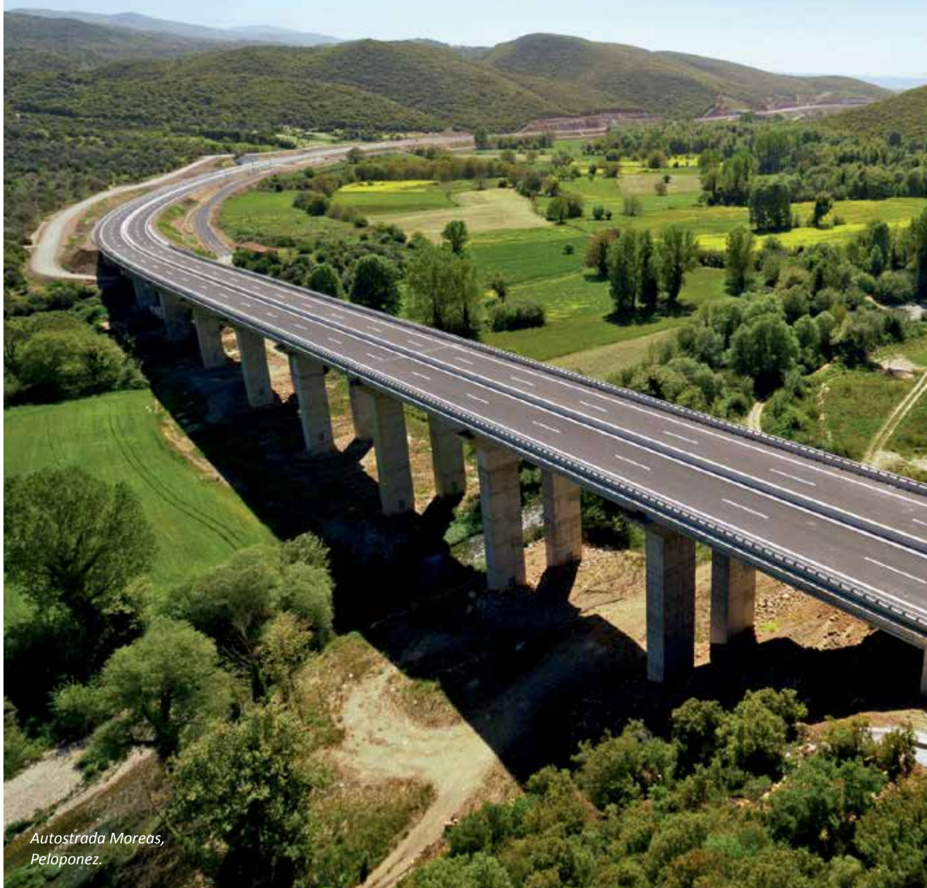
Autostrada Moreas, Peloponez.