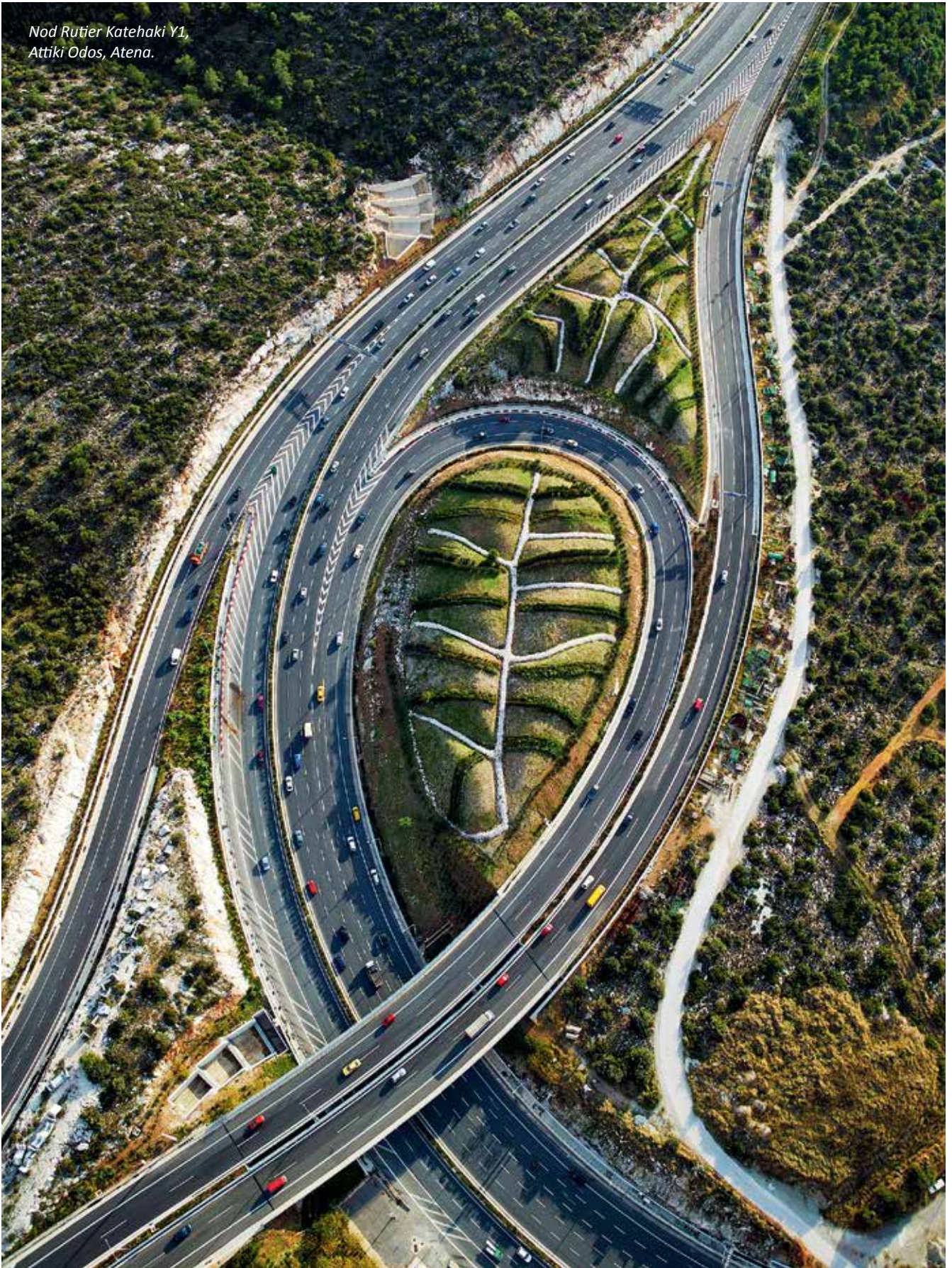
Nod Rutier Katehaki Y1, Attiki Odos, Atena.