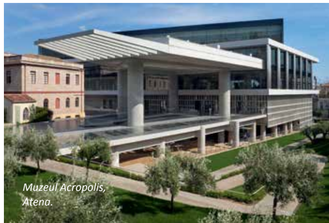
Muzeul Acropolis, Atena.

Pe lângă instruire, au fost introduse și alte inițiative de comunicare pentru a asigura conștientizarea conformității în cadrul ELLAKTOR. Angajații și conducerea sunt informați prompt cu privire la noile politici sau proceduri