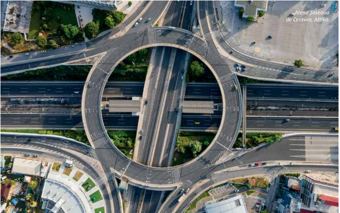
Atena Șoseaua de Centura, Attika.