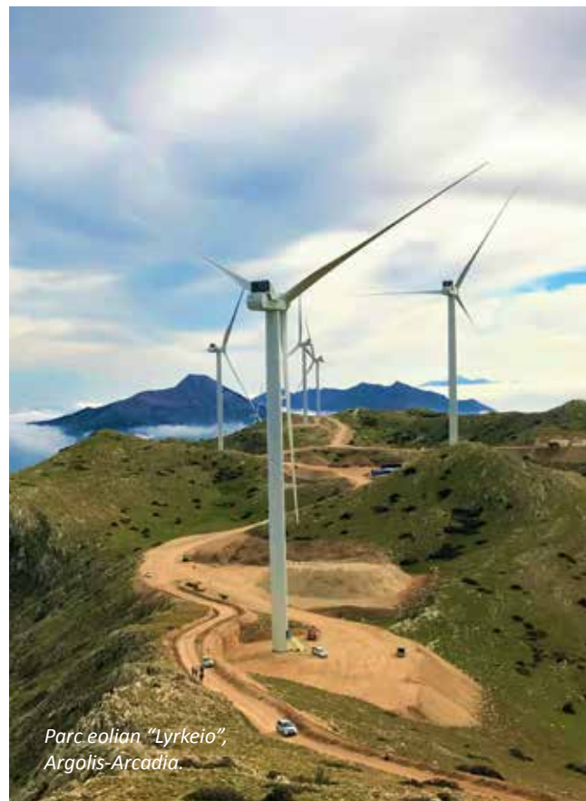
Parc eolian "Lyrkeio", Argolis-Arcadia.