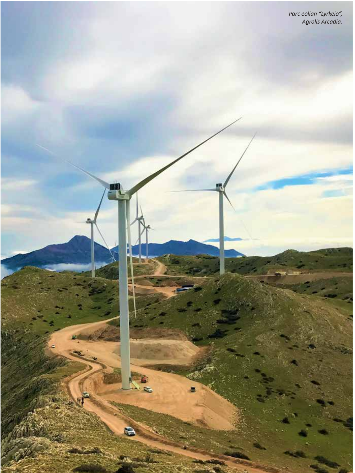
Parc éolien "Lyrkeio", Agropolis Arcadia.