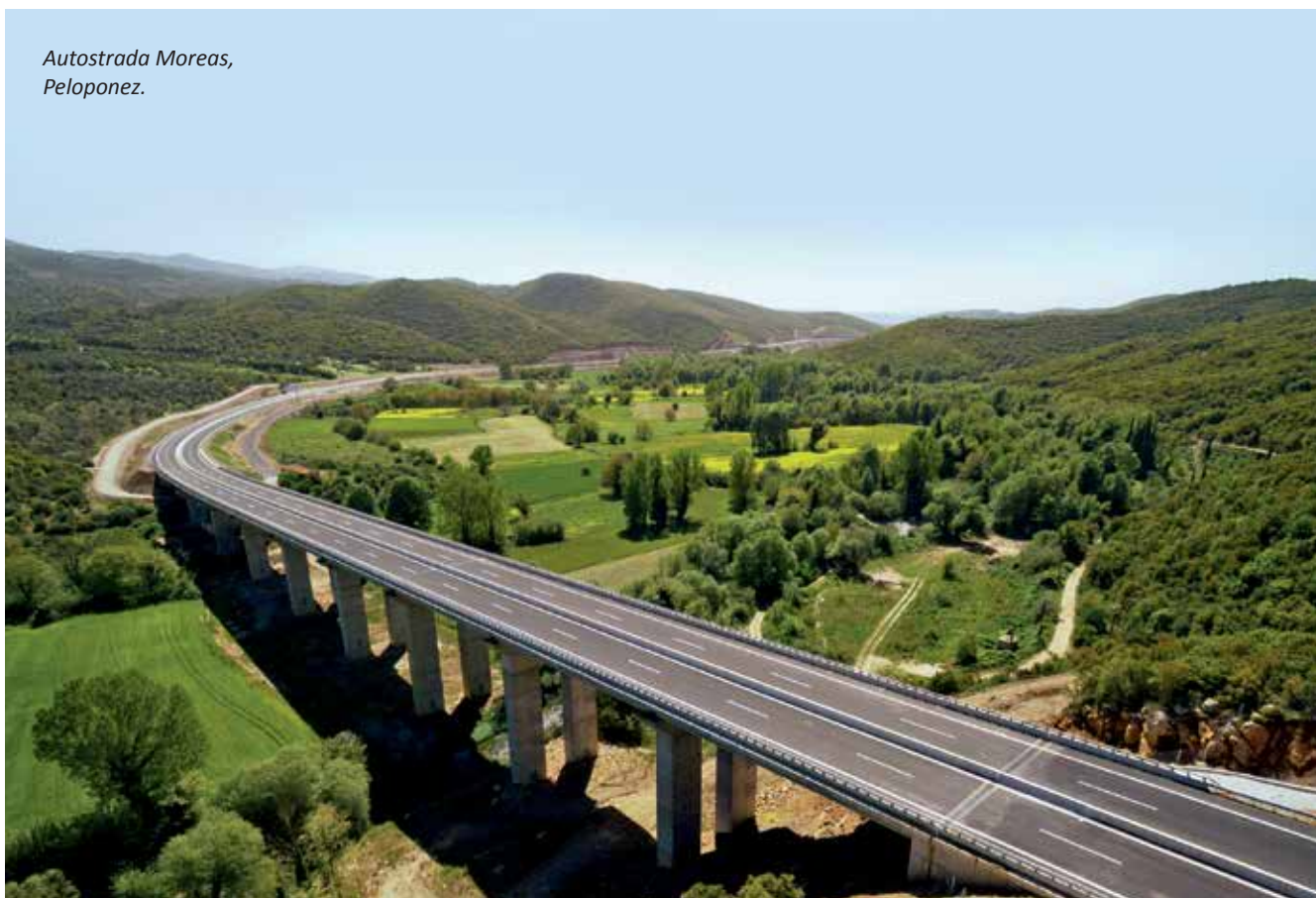
Autostrada Moreas, Peloponez.