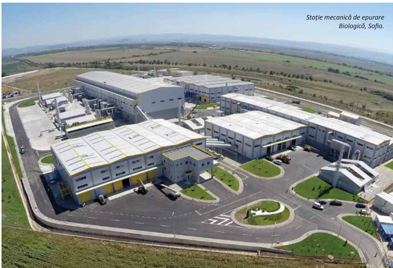
Stație mecanică de epurare Biologică, Sofia.

Partenerii de afaceri pot avea acces la informații confidențiale ca parte a relației de afaceri. Aceste informații nu trebuie să fie împărtășite cu nimeni, fără autorizația exprimată de Ellaktor. Anumite angajamente pot necesita, de asemenea, schimbul de informații personale. În acest scop, ne asigurăm că prelucrarea și stocarea acestor informații se realizează în conformitate cu legile și reglementările respective privind confidențialitatea datelor și că este implementat un cadru adecvat de securitate a informațiilor.